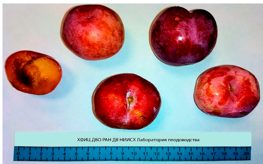
Рисунок 2 – Плоды сливы китайской, сорт Мисс Хабаровск

Плоды средней массой 63,4 г, максимальной 80,9 г; одномерные, округлые. Вершина плода округлая, средне вдавленная; воронка мелкая, узкая. Основание плода без углублений; ямка мелкая, узкая. Брюшной шов средней глубины, малозаметный. Плодоножка короткая, тонкая; плохо отделяется от ветки; прикрепление к косточке непрочное. Основная окраска плода зелёная, покровная – тёмно-красная, мраморовидная. Подкожных точек нет. Кожица не грубая, голая, со слабым восковым налетом, с плода снимается легко (рис. 2).