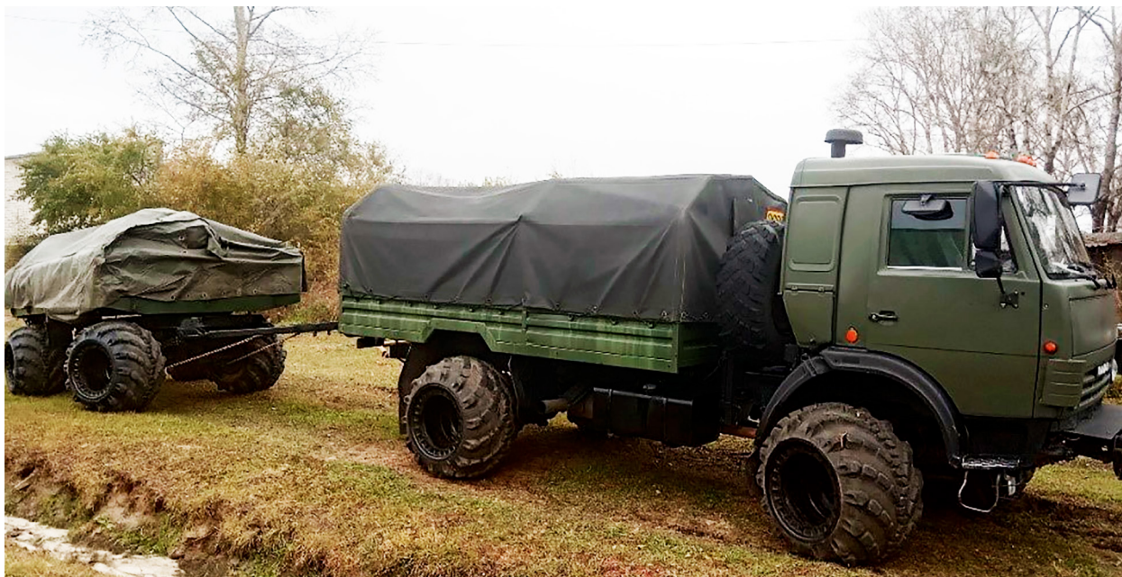
Рисунок 2 – Автомобиль КамАЗ-4350 с установленным догружающим модулем для грузового автомобиля и прицепом ПН-4М на арочных шинах в ходе проведения транспортной операции