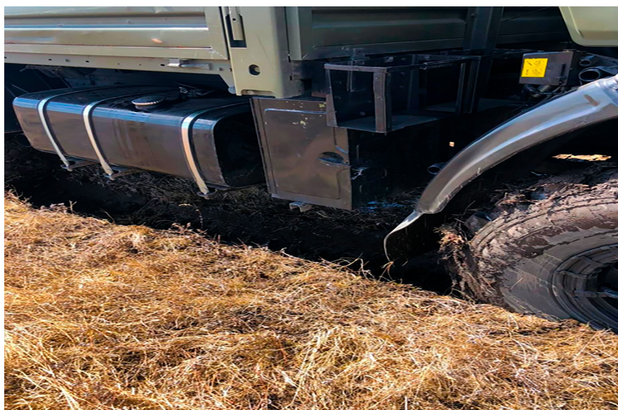
Рисунок 6 – Фрагмент проведения тяговых испытаний с серийным автомобилем

Для определения техногенного воздействия на почву ходовой системы автомобиля КамАЗ-4350 были проведены экспериментальные исследования при транспортировке урожая с поля. В качестве исследуемого параметра взята глубина колеи. Фрагменты проведения испытаний представлены на рисунках 7, 8.