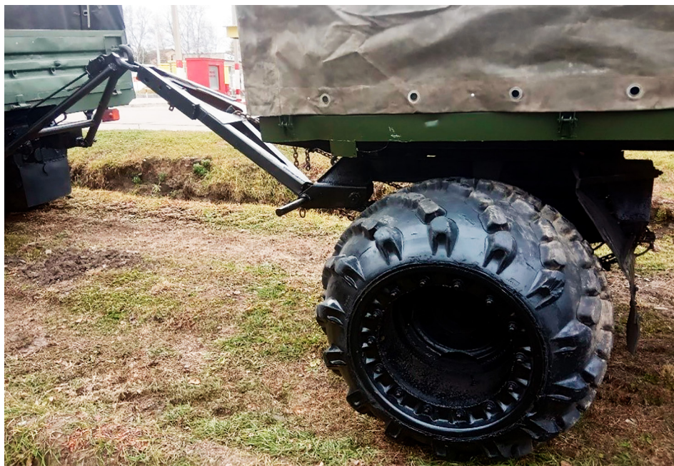
Рисунок 4 – Работа тягово-сцепного устройства и нагрузка дышла прицепа