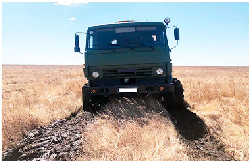
Рисунок 8 – Фрагмент прохода по полю автомобиля на арочных шинах

Как показали проведённые исследования (табл. 1), после прохода по полю как серийного, так и экспериментального автомобилей остаётся транспортная колея.