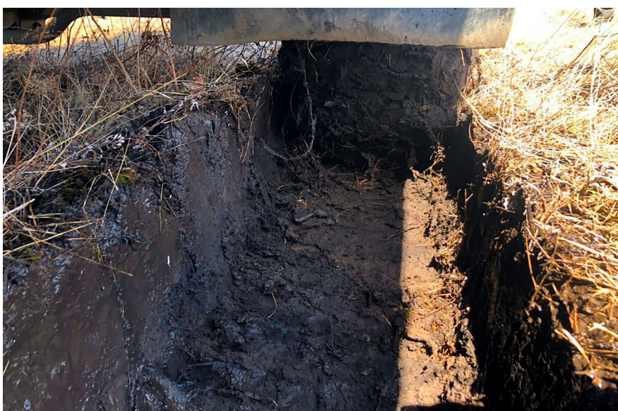
Рисунок 7 – Фрагмент прохода по полю автомобиля на серийных шинах