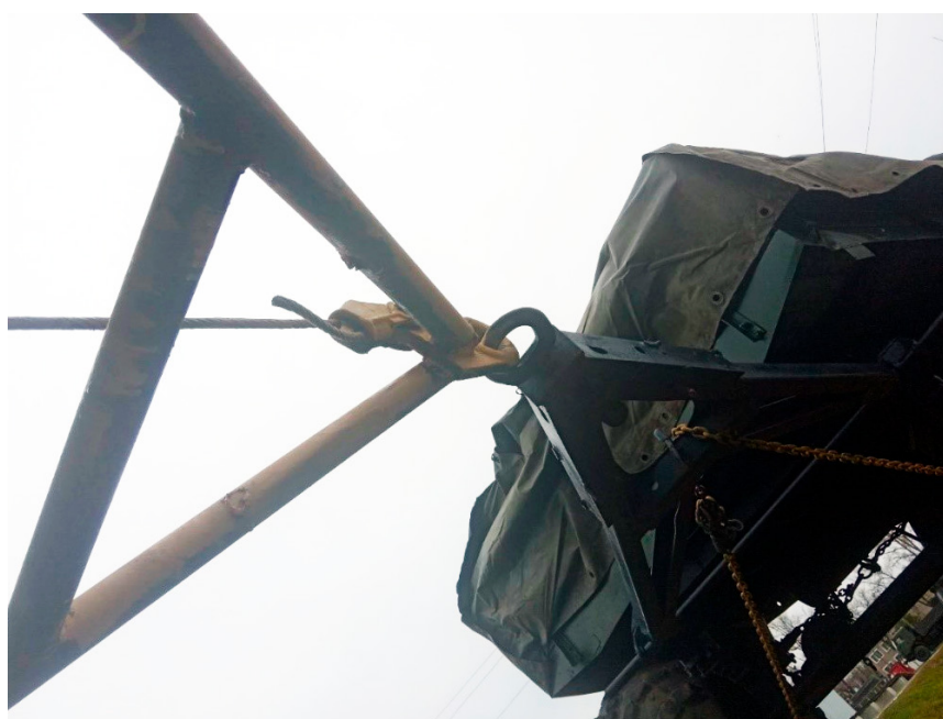
Рисунок 3 – Догружающий модуль для грузового автомобиля

периментальные исследования в реальных условиях эксплуатации транспортных агрегатов в период уборки основной культуры региона – сои.